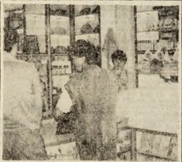
BRAD. Magazinul de artizanat al Cooperativei de Consum. Cumpărătorii pot găsi aici un bogat sortiment de cadouri pentru cei dragi.