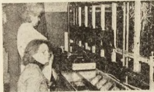
În laboratorul de contoare se urmărește cu atenție producția de energie electrică pulsată spre beneficiari.

Concomitent cu reparația capitală, la grupul planificat se fac și lucrările de rețehnologizare stabilite. Eficiența acestora se va regăsi într-o mai bună funcționare a instalațiilor.