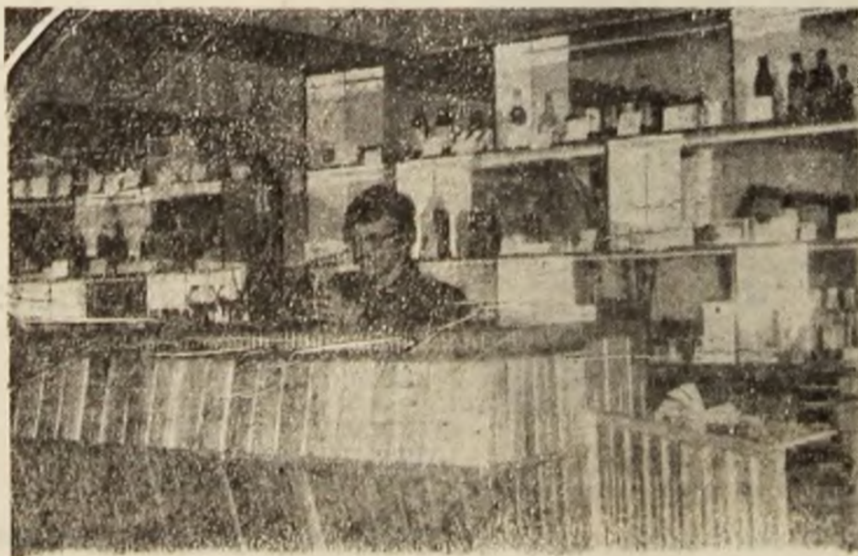
Complexul „Gateșul” compus dintr-o sală cu autoservire, bar și berărie, este situat chiar în centrul Hațegului.

treburilor profesionale atribuite. În anul 1991 au fost trimise la studii de perfecționare profesională 10 persoane. În prezent, componenții unității se ocupă cu rezultarea de tiraj pentru adresele de distribuție.