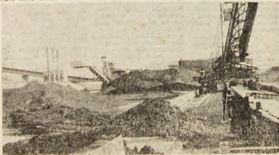
După cum se vede, stocul de cărbune este destul de „subțire”.

• S-a asigurat plata integrată a salariilor lunare, fără diminuări, aplicarea indexărilor, a primelor, gratificațiilor, primelor jubiliare pentru personalul cu vechime îndelungată, a ajutoarelor bănești și primelor la pensionare.