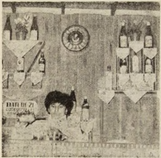
Motelul „Sarmizegetusa” oferă o gamă largă de produse și băuturi.