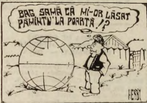
Desen de GHEORGHE VALENTIN HARBAN