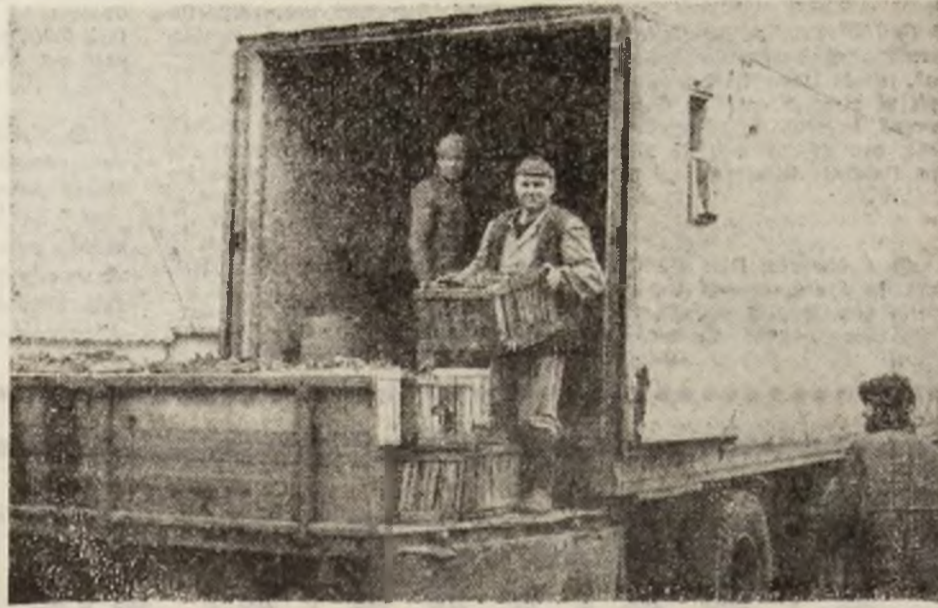
La Ferma nr. 8 Băcia a S.C. „Sansere” S.A. Sîntandrei se încarcă spanacul pentru un nou transport spre piață.