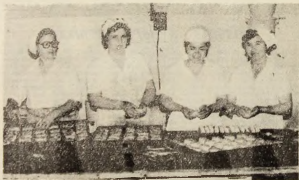
În laboratorul patiseriei „Cuptorul de aur” din Hunedoara, personalul mîntății își etalază pricepterea în produse de calitate superioară.