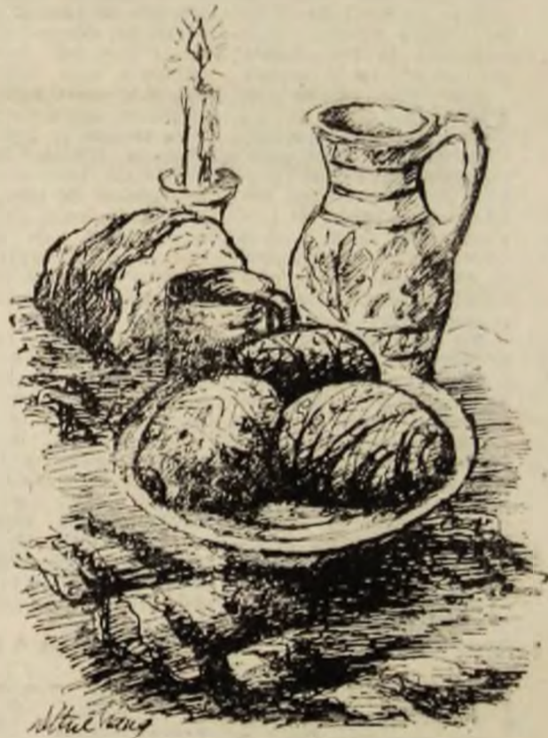
Desenele din pagină de DORINA FUL CRANG