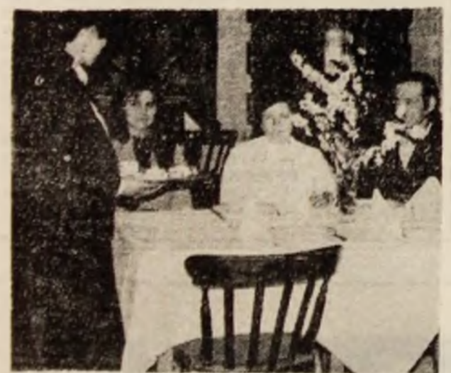
La restaurantul hotelului „Diana“ bogat sortiment de preparate și băuturi, servire promptă, ireproșabilă.