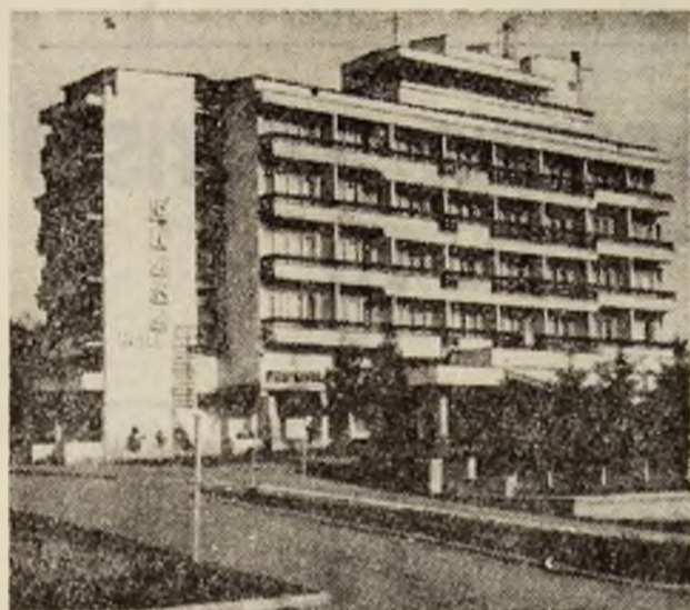
„Diana“ își așteaptă oaspeții viitorului sezon turistic, pregătită din toa te punctele de vedere.

— Este, deși ne confruntăm cu necazurile tranziției. Omul este dator să fie optimist, iar cei de la S.C. „Germisara“ S.A. Geoagiu-Băi sint și ei oameni. Cu acest sentiment așteptăm oaspeții noului sezon turistic.