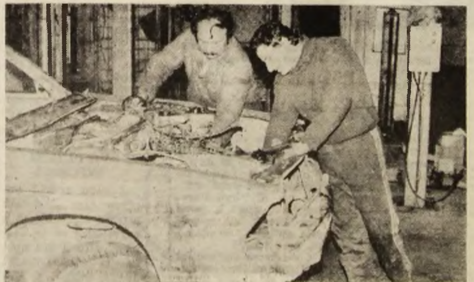
Servicii de calitate, executate prompt, de meseriași cu înaltă calificare.

Cei 37 de meseriași de înaltă calificare asigură prestații prompte, de o calitate apreciată, în domeniul depanărilor auto.