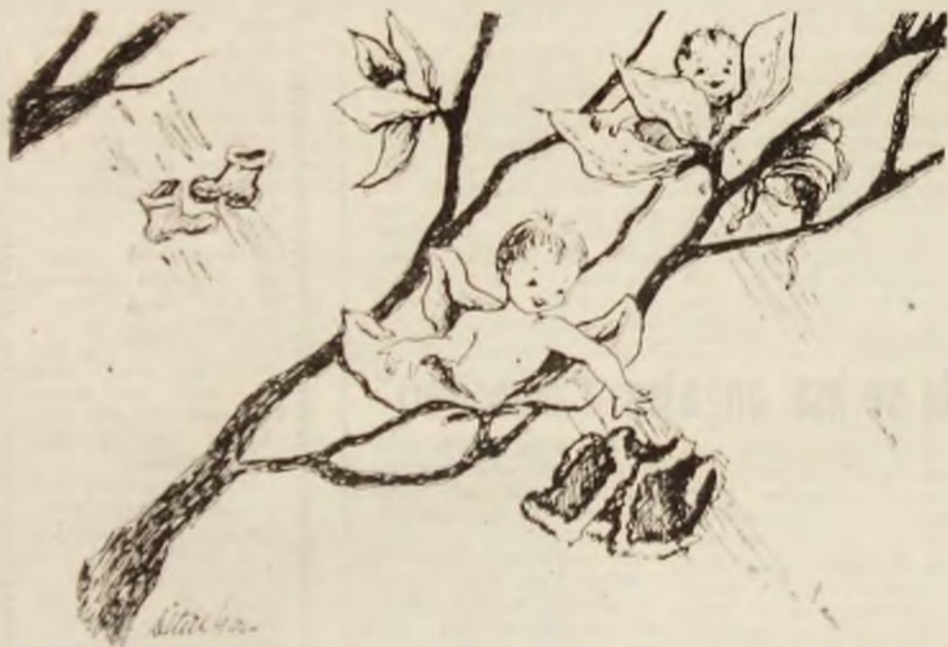
Desen de DORINA IUL CRING

Să ne reamintim de Festivalul umorului, ediția I, purtînd numele „Liviu Oros”.