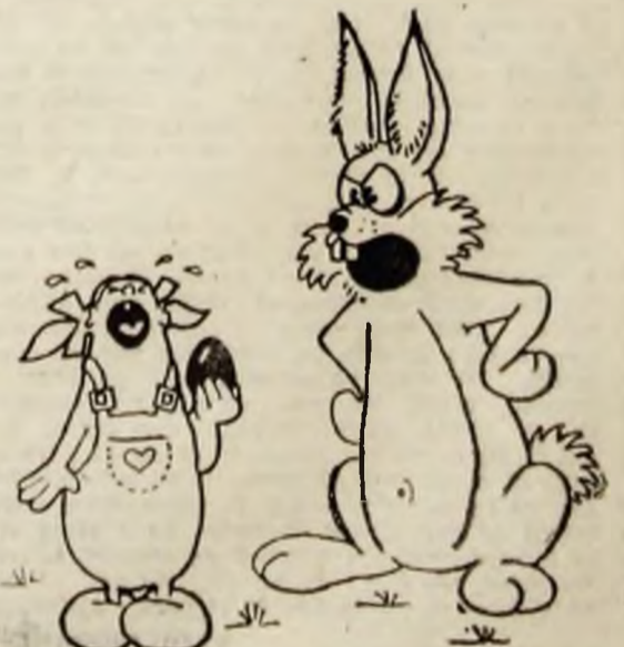
-CU PREȚURILE ASTEA, MAI AI ȘI PREȚENȚII.