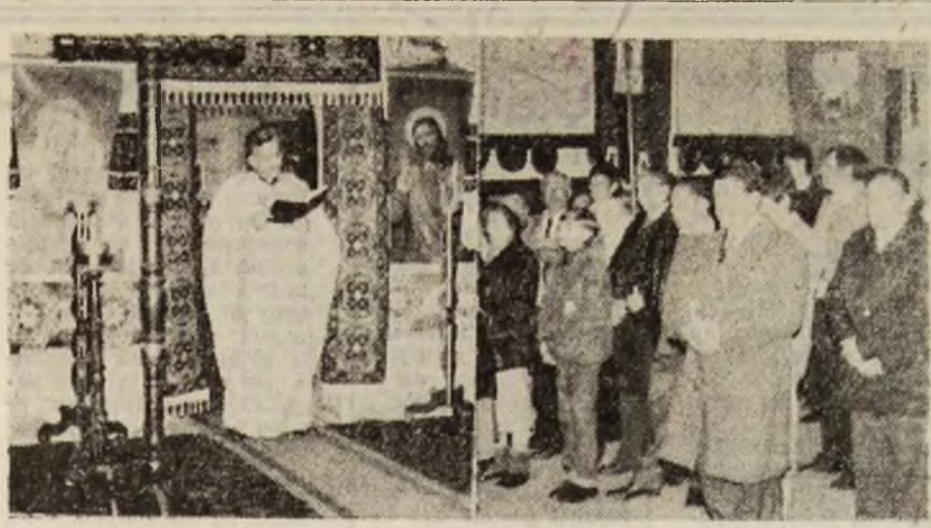
Služba de înviere la Biserica — monument istoric de la Tebea.