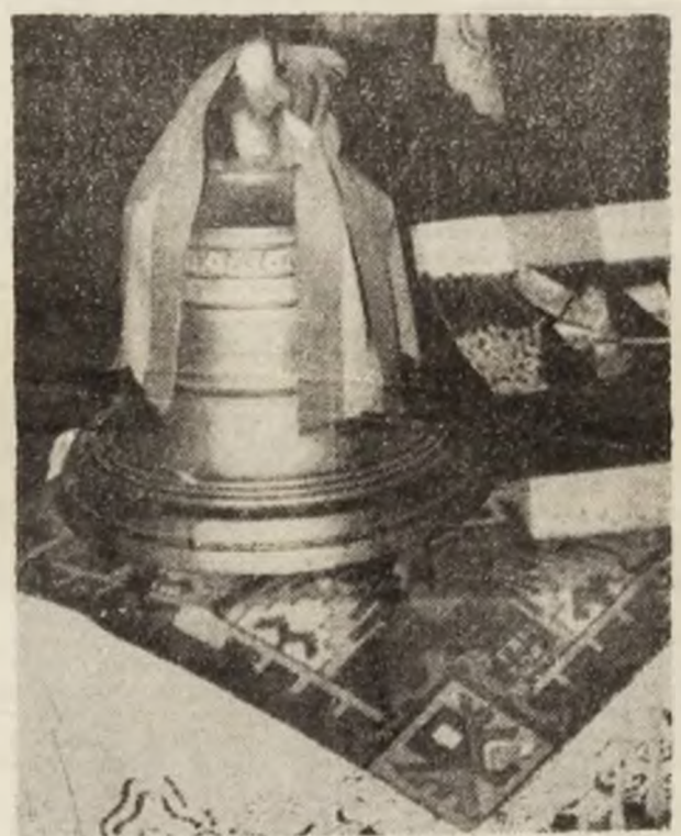
Clopotul care a vestit cu tristețe și durere moartea eroului Avram Iancu, clopot aflat în Muzeul de la Tebea.