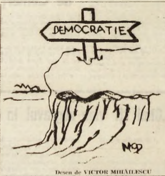
Desen de VICTOR MIHĂILESCU