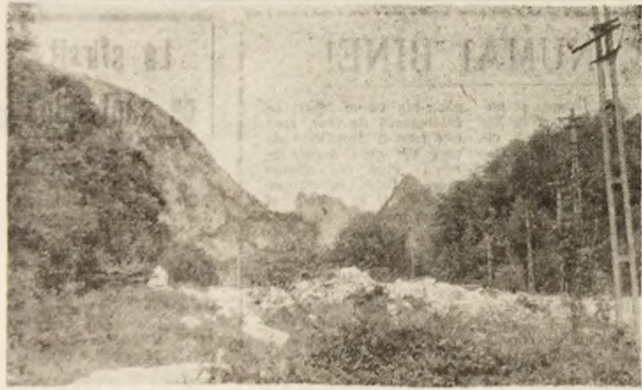
Invitație la drumetrie în Munții Apuseni.

v-ați ridicat voi, neînfrinți luptători, în noaptea cea plină de suferințe a vieții românești, ca să ne arătați calca minții. Dar stăpiniți întinericului, dușmanii libertății popoarelor, au sărit ca să vă stingă puterea luminatoare, aruncându-vă în mucegali temnițelor. Prea târziu! Focul lubirii de neam s-a aprins și arde cu flăcările sune în inimile milioanei de români. Veți merge, deci, cu fruntea ridicată înaintea judecătorilor voștri, căci nu voi, ci prin voi, întregul popor român va fi judecat. Cu voi sintem, căci voi pentru noi suferiți!”. Aceste fapte demonstau lumii că Memorandumul a fost al întregului popor român, că procesul intenționa frunțașilor luptei politice, a inițiatorilor acestora, este, de asemenea, procesul întregii națiuni române, că izbândă dreptății nu era departe.