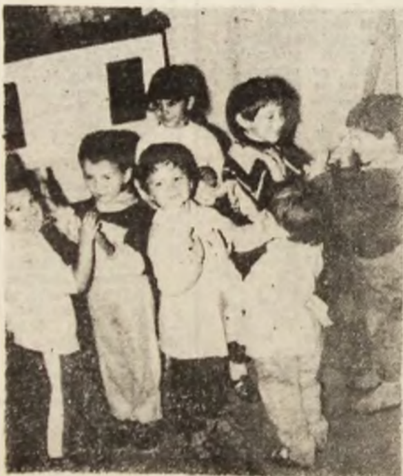
Copiii noștri frumoși, iubiți.