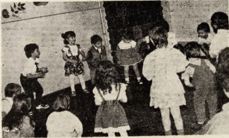
Final de an nu numai în școli ci și în cămine și grădinițe. Zilele acestea, prichindeii noștri dragi au trăit, deopotrivă, emoțiile momentelor artistice alături de părinți, precum și de educatori. Imaginea de față reprezintă un asemenea moment consacrat luni, 8 iunie, la Grădinița cu program prelungit nr. 1, Deva.

— Cum a reacționat tatăl tău cînd i-ai arătat carnetul de note? — Absolut normal: m-a urecheat.