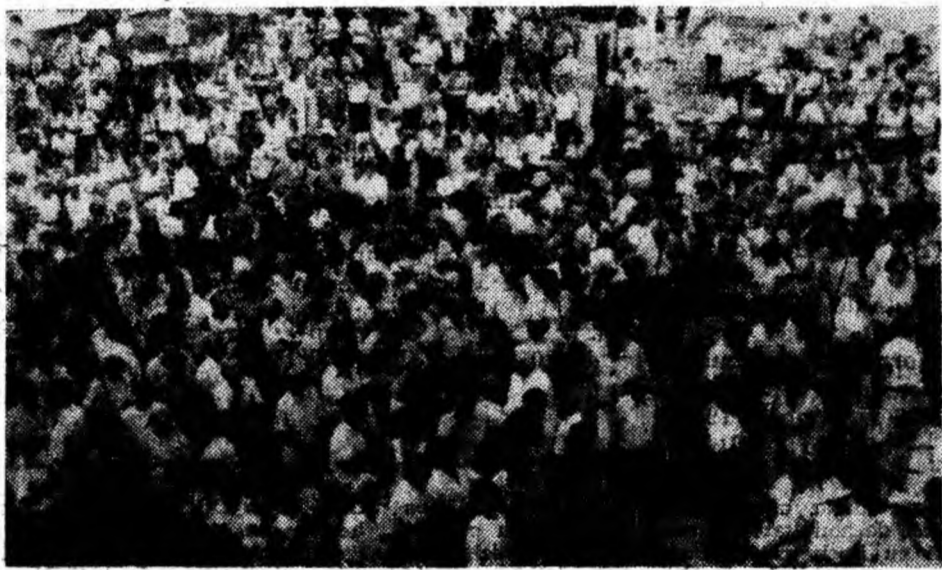
Aspect din timpul mitingului electoral organizat de Convenția Democratică.