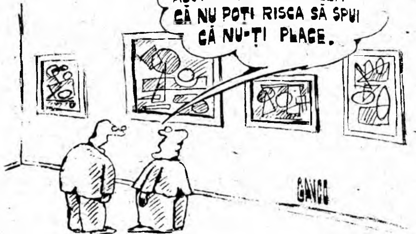
Desen de CONSTANTIN GĂVRILA

AVANTAJUL PICTURII ABSTRACTE ESTE ACELA CĂ NU POTI RISCA SĂ SPUI CĂ NU-ȚI PLACE.