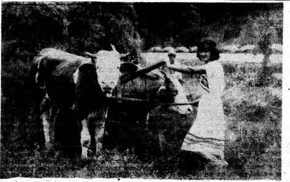
Finul de curînd cosit... este transportat cu carul spre adăpost.