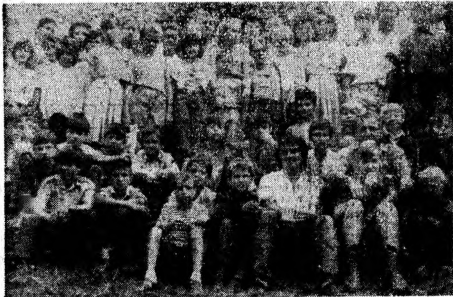
Copiii de polițiști moldoveni de pe Nistru, găzduiți în tabăra de la Cinciș Prin grija sindicatelor „Rusca” — „Mina” Ghelari și „22 Decembrie”, au fost oaspeții Festivalului pădurenesc „La izvor de cînt și dor” din Ghelari.

Camera de Comerț și Industrie a județului Hunedoara — Deva vă invită să vizitați expoziția internațională „FARMER EXPO '92” de la Debreceen — Ungaria, care va avea loc în perioada 8—13 sept. a.c. și la care vor expune firme producătoare de mașini, utilaje și echipamente agricole, echipamente și tehnologii pentru protecția mediului, produse agricole. Detalii privind organizarea vizitei se pot obține de la Camera de Comerț și Industrie a județului Hunedoara, telefoane: 95/612924, 614863, în zilele de lucru, între orele 9—15.