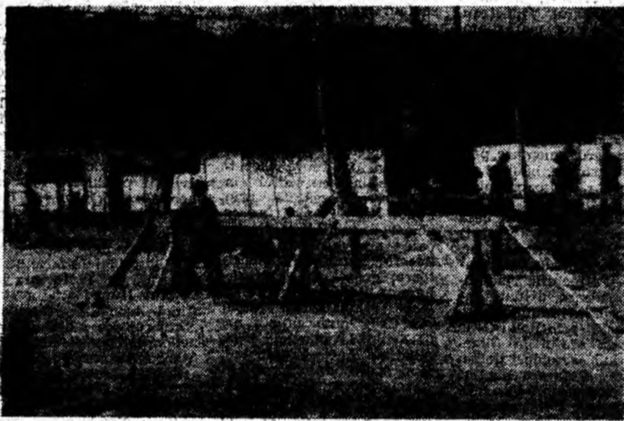
Ieri, la Orăștie s-a încheiat faza zonală a concursului pompierilor militari. Fotoreporterul nostru a surprins pe peliculă aspecte din timpul desfășurării concursului care a reliefat faptul că pompierii militari sînt bine pregătiți să îndeplinească misiunile încredințate.