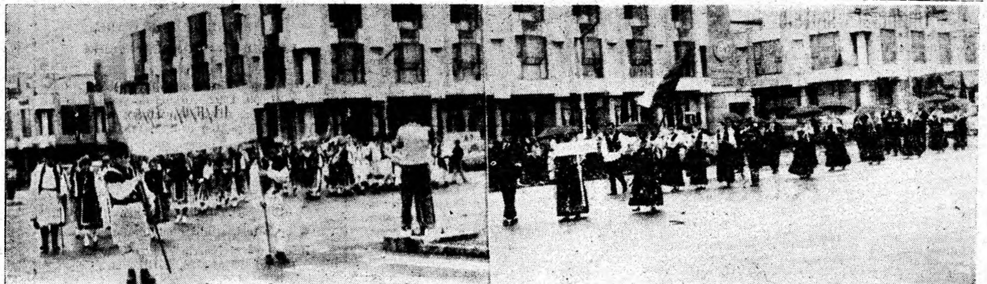
Aspect de la parada

● Începînd de luni, 7 septembrie, s-a redeschis aeroportul de la Suceava, după ce timp de aproape trei luni a fost supus unor reparații în valoare de 121 milioane de lei. Lucrările executate de Societatea Comercială Construcții Feroviare Iași au cuprins pista de aterizare, instalațiile de încălzire și apă potabilă a aeroportului.