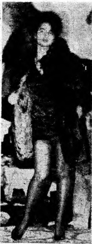
S.C. „Favior” S.A. Orăștie — o prezență de marcă la Expoziția-tîrg de blănuri din Deva.