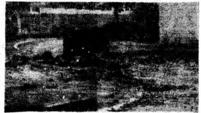
Sint apreciate eforturile făcute pentru întreținerea rețelei de termoficare dar este păcat că în urma acestor lucrări rămîn blocate căile de acces spre blocuri.