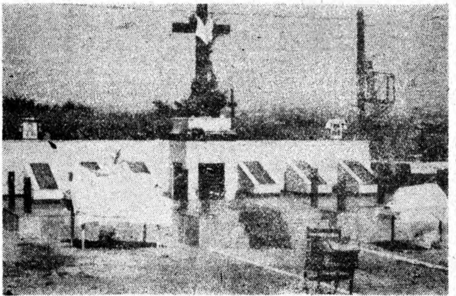
Satul Pătrăuții de Jos — 173 de morți.