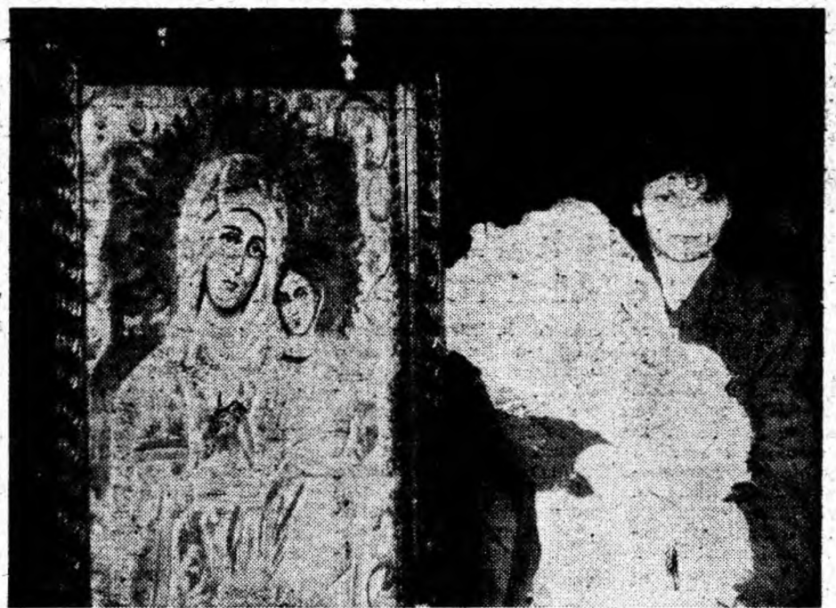
După botez, moment de reculegere lângă icoana Maicii Domnului.