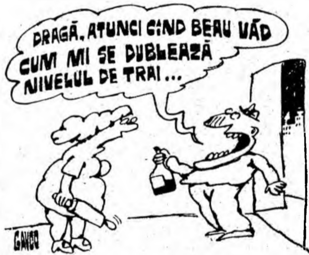
Desen de CONSTANTIN GAVRILA

Trei doctori americani au publicat în „New England Journal of Medicine“ un articol în care cer sprijinul public pentru legalizarea practicii de „sinucidere asistată de medic“ în cazul pacienților care suferă de o boală incurabilă, care provoacă suferințe care nu pot fi alinate. Unul dintre autorii articolului afirmă că numărul medicilor ce au ajutat pe un pacient să se sinucidă poate varia între 3 și 37 la sută din totalitatea corpului medical, dar că este necesar să se elaboreze o legislație care să permită urmărirea îndeplinirii unor obligații clare pentru cei care comit sinuciderea sau care o asistă: existența unei maladii incurabile, solicitarea bolnavului, acordul familiei, care este solicitat, dar nu este obligatoriu etc. De asemenea, medicul, care prescrie substanța care va pune capăt vieții pacientului, va trebui să se afle alături de el în momentul ales de acesta pentru a o lua, informează REUTER.