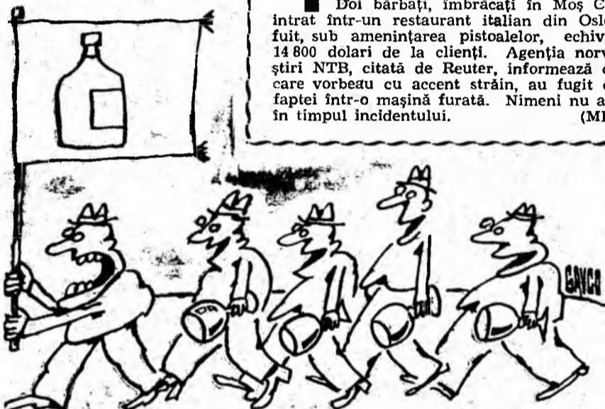
Desen de C-TIN GAVRILA