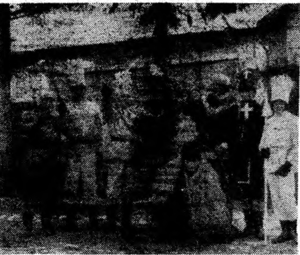
Spectacolul Irozilor — un impresionant obicei de sărbători prinde iarăși viață.