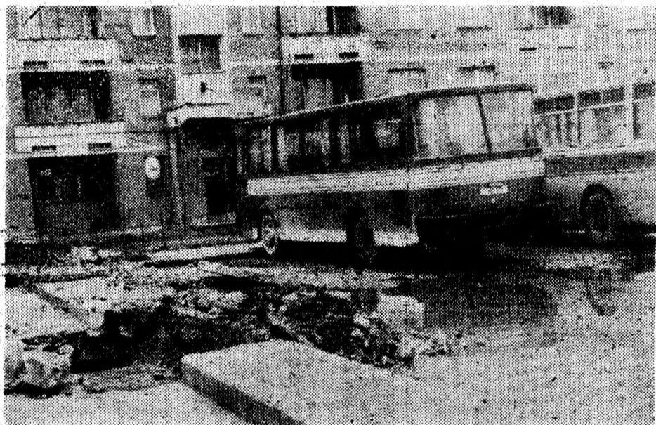
Aceste săpături, desigur nu... arheologice pot fi „vizitate” în Autogara din Brad.

Un grup de tineri inimoși din satul Mărtinești au colindat în prima zi de Crăciun, după datină, mergînd cu „Călușerul”. Oamenii i-au primit cu căldură și multă emoție. Și pentru ca bucuria obiceiurilor de iarnă să fie completă, tinerii au petrecut și Revelionul împreună, procurîndu-și singuri cele necesare. (M.B.)