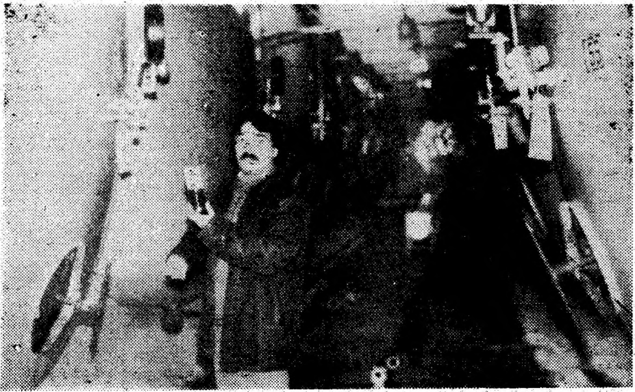
În procesul de fermentație secundară, la S.C. „Haber Hațeg se recoltează periodic probe pentru determinarea corectă a fermentării.