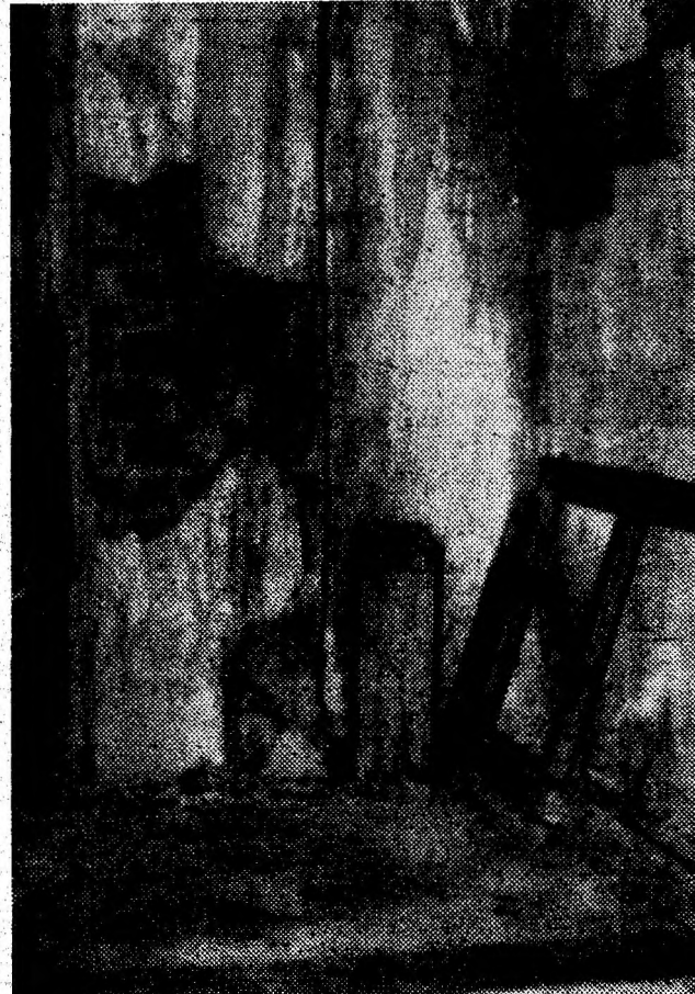
La intrarea în blocul nr. 61, unde sînt poștii „responsabili” de la R.A.G.C.L., primăria locală, Consiliul județean.