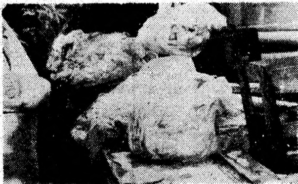
90 kg de burtă de vită, aruncată în spatele magaziiilor, dar fără acte de scoatere din consum. În local se oferea clienților... ciorbă de burtă.

Sînt doar câteva constatări în alb-negru dintr-o zi de activitate a colectivelor de control. Scopul acțiunii a fost nu de a descuraja comerțul de pe drumurile naționale, ci, dimpotrivă, de a-l ridica la nivelul cerințelor normale ale comerțului legal, modern și civilizată oriunde s-ar desfășura el.