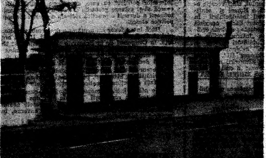
La ieșirea din județ spre Alba Iulia, un buncăr frigorific așezat pe o fundație (fără autorizarea ni mănui) și... bufetul e gata!