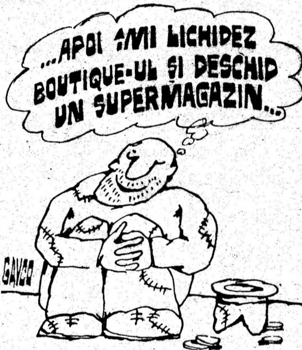
Desen de CONSTANTIN GAVRILA

carne de cal, au ajuns la 160 de dolari. În timpul infloririi economice a Japoniei din anii '80 s-au chel-tuit sute de mii de dolari pentru importul de rase faimoase și creșterea min-jilor, relatează agenția REUTERS.