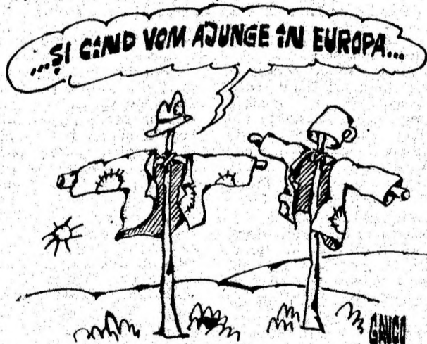
Desen de C-TIN GAVRILA