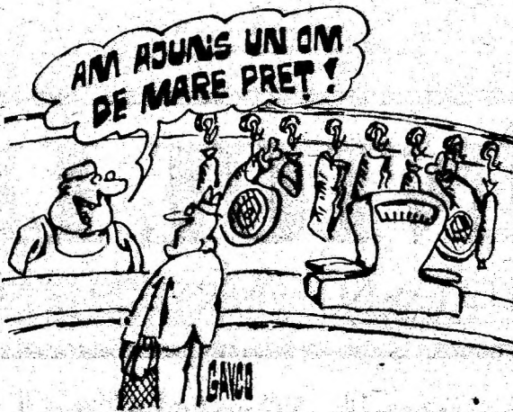
Desen de C-TIN GAVRILA