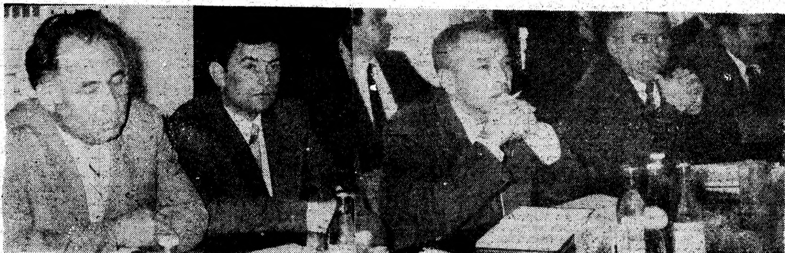
La R.A.H. Petroșani s-au abordat în detaliu problemele mineritului.