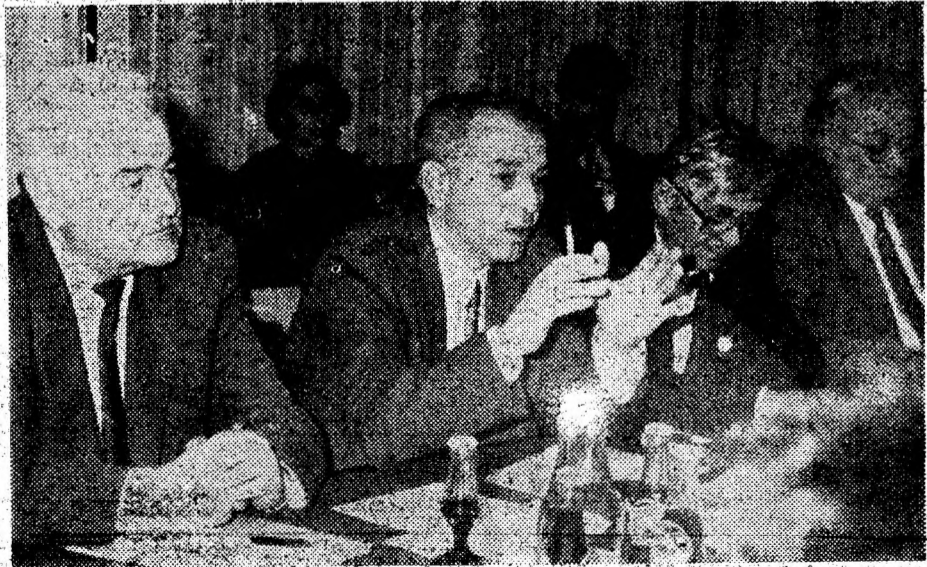
Întîlnirea de la S.C. „Siderurgica” S.A. Hunedoara a fost foarte fructuoasă.