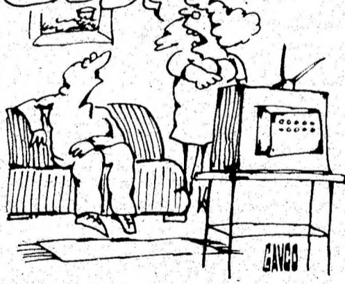
Desen de C-TIN GAVRILA