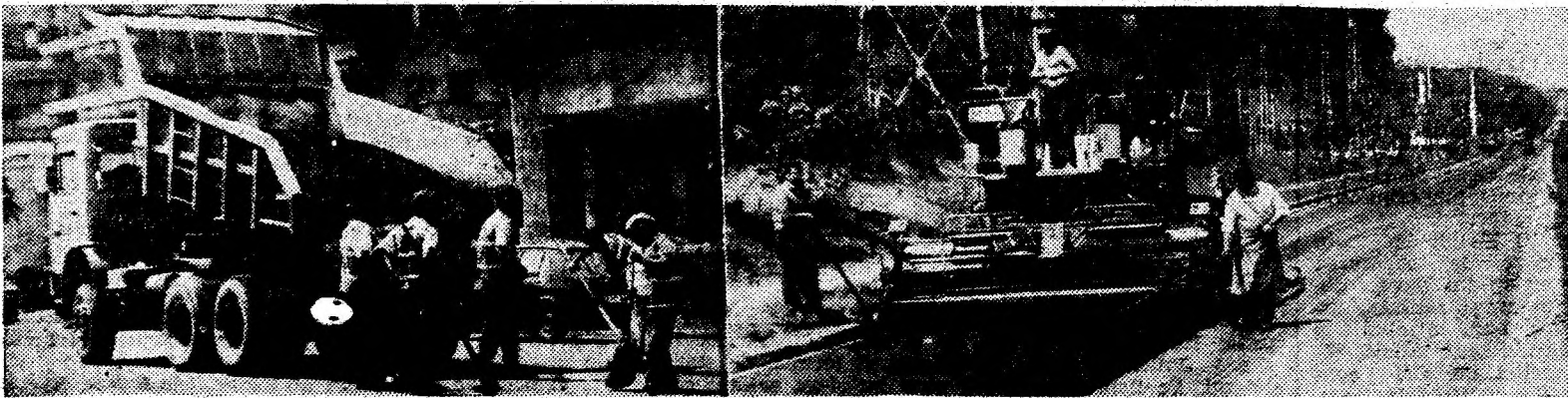
Atât RAGCL Deva, cât și secția din localitate a Regiei de Drumuri Naționale, au „atacat”, cu mijloacele de care dispun, principalele artere de circulație ale orașului.

după informațiile noastre, au cerut furnizorii să distribuie doar 16 ore din 24, fiind oprită noaptea (între 22 seara și 6 dimineața). Este posibil ca din aceleași asociații alți locatari să dorească furnizarea non-stop a apei calde. Este imposibil să mulțumim pe toată lumea. Dacă dăm curs solicitărilor exprimate de asociațiile de locatari nominalizate este pentru că trebuie să se țină cont de problemele oamenilor, iar soluția găsită să răspundă majorității opțiunilor. (V. ROMAN).