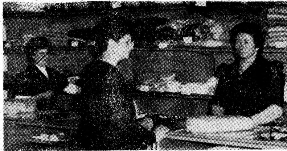
La unitatea textile-confecții din Dobra, buna aprovizionare și servirea plină de solitudine merg mână în mână.

Interviu telefonic realizat de MINEL BODEA