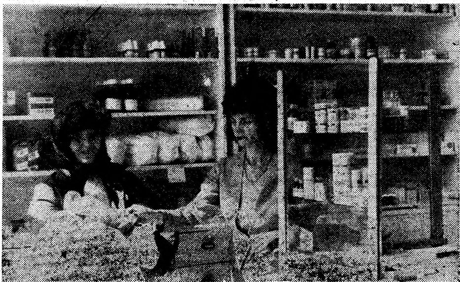
Farmacia din Pui este o noutate. Ea a fost deschisă recent și satisface nevoile de medicamente ale locuitorilor comunei și satelor din împrejurimi.

Marți la ora 13, în Deva, mijloacele de alarmare antiaeriană au sunat alarma. Nu, nu începuse nici un război. Era semnalul pentru populație de începere a „exercițiului de alarmare publică”.