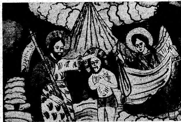
BOTEZUL LUI IISUS (icoană provenind din Tara Bârsei, sec. XIX).