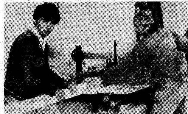
Atelierul de tâmplărie al S.C. Metalotex, situat în orașul Hațeg, execută lucrări de calitate la sediul și la domiciliu, bucurându-se de aprecierea clienților.