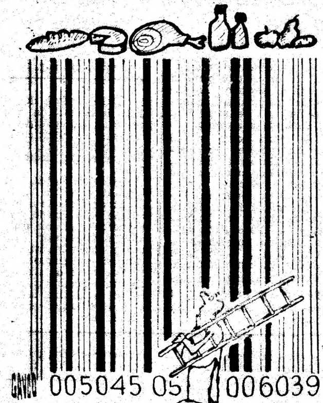
Desen de C-TIN GAVRILA