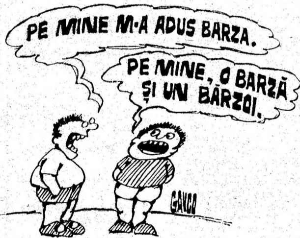
Desen de G-TIN GAVRILĂ

Dl. Iosif Gavrilă ne scrie cu indignare că la Aurel Vlaicu crescătorii de animale sunt nevoiți să dea laptele în hrana porcilor. Pricina provine din faptul că mașina de colectare a acestui produs ocolește, se pare fără nici un fel de motiv întemeiat, această localitate. Situația este cu totul nefirească, dacă se ține seama că la oraș se resimte acut criza de lapte, așteptându-se curmarea ei în timp cât mai scurt. (N.T.).