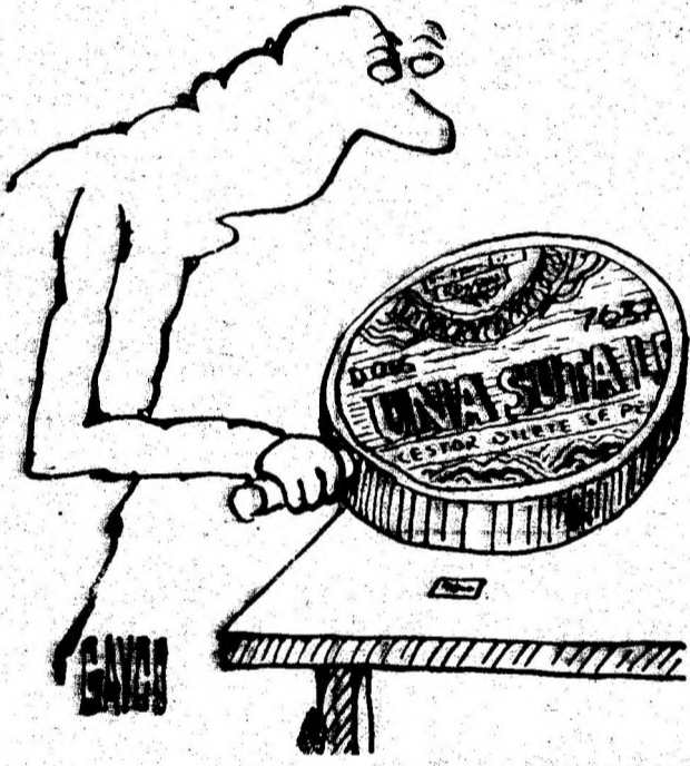
Desen de CONSTANTIN GAVRILA

Dar, dacă momentan setea a fost potolită și în organism simțim o înviorare, trebuie să știm că abuzul de răcoritoare ne provoacă mai târziu o serie de neplăceri ce se manifestă prin răgușeală, tuse, amigdalită, dureri etc. Lăchidul rece pătruns în stomac provoacă o descărcare reflexă a bilei, care, ajunsă instantaneu în intestina în cantitate prea mare, are efectul unui purgativ, producând diaree și crampe intestinale. Iată, așadar, unde poate duce consumul excesiv de băuturi răcoritoare. Trebuie să înțelegem, însă, că prin cete arătate nu am făcut o pledoarie împotriva răcoritoarelor, ci este necesar ca ele să aibă temperatura acceptabilă consumului, să fie ingerate (înghițite) încet, în cantități mici, dar organismul nostru să nu fie prea încălzit sau prea obosit. (D. N. S.).