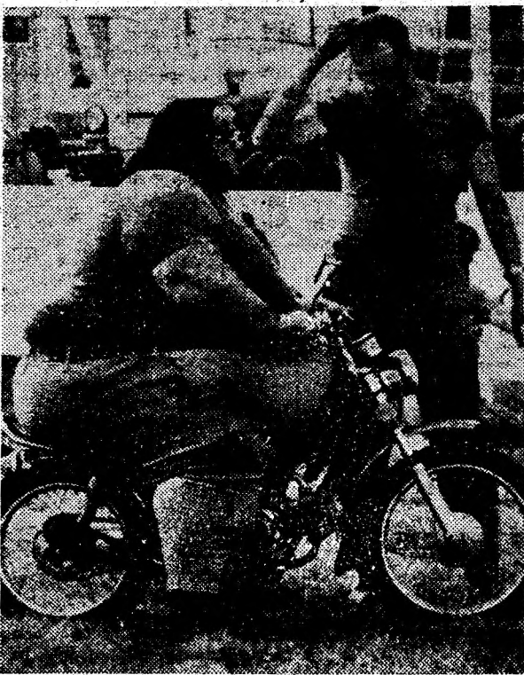
— Carburatorul e fi de vină?