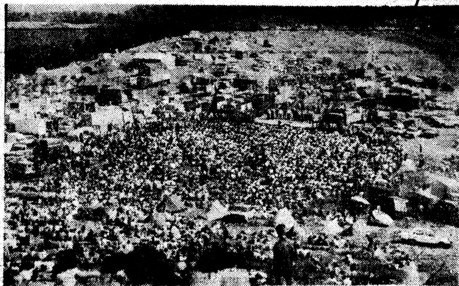
Duminică, 18 iulie a.c., mii de oameni din Țara Moșilor și din împrejurimi au reînnoțat un vechi obicei — Târgul de Fete de pe Muntele Găina.