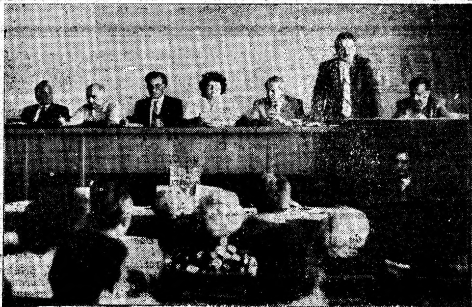
Imagine de la simpozionul ce a avut loc la Orăștie, dedicat caștirii memoriei dr. Aurel Vlad, înflăcărât susținător al luptei pentru emancipare și unitate națională.

S.C. Comat S.A. Hunedoara—Deva și S.C. Mureșul S.A. Șoimș au donat Filialei de Cruce Roșie a județului sume de bani, pentru care această organizație va realiza două tabere. Copiii proveniți din familii cu venituri modeste, elevi la Școala generală nr. 3 Deva, își vor petrece câteva zile de vacanță în tabăra de la Zanka (Ungaria). Tabăra este sponsorizată de Crucea Roșie Română, filiala județului nostru asigurând transportul copiilor. Pe participanții care s-au remarcat în cadrul concursului „Sanitarii pricepuți” filiala i-a invitat să-și petreacă o parte din zilele de vacanță într-o tabără găzduită de Baza sportivă din Parâng. (V.R.)