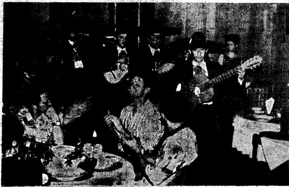
O formație muzicală din Mexic a concertat la Restaurantul „Lido” din Deva.

Pe strada A. Mureșanu din Deva, vizavi de laterală Casei de Cultură, se află un pasaj de trecere spre Aleea Patriei. Întrândul este folosit însă, pe timpul nopții, pentru treburi... mici. Dimineața trecătorii și locatarii din zonă au neplăcuta surpriză să înfăleze mirosurile degajate de asfaltul ce începe să se încălzească. Când vor învăța ignoranții civilizația străzii, respectul pentru semeni? (V.A.)