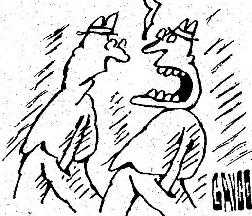
Desen de G-TIN GAVRILA