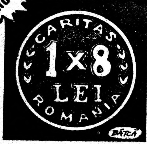
Desen de MIRCEA BĂTCA