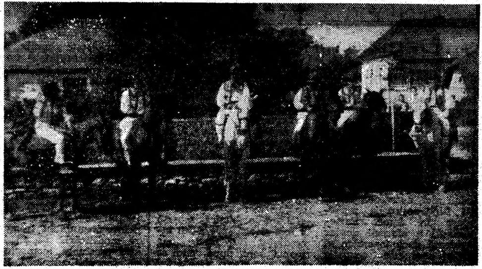
Pe drumuri de munte, calul rămâne un prieten statornic al pădurenților.