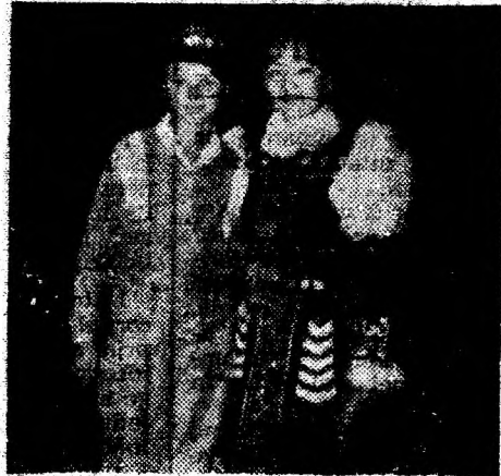
Turismul oferă și prilejul de a lega prietenii.

— Judecând după datele bilanțului la semestrul I din 1993, a rezultatelor din celelalte 2 luni, rezultatele sunt încurajatoare. Un agent economic care încheie o perioadă bilanțieră cu profit, are, cred, dreptul să fie optimist. Societatea noastră a încheiat un semestru din acest an cu un profit impozabil de peste 5 milioane lei și o contribuție la rezervele valutare ale statului de peste 12 000 dolari SUA, nu-