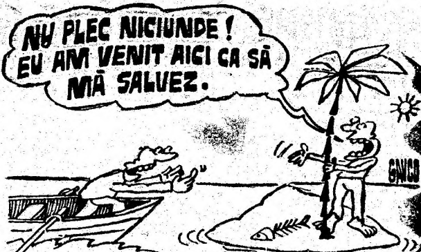
Desen de CONSTANTIN GAVRILA