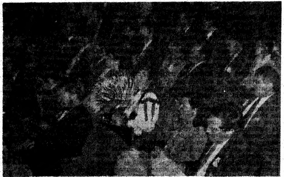
Imagine în timpul desfășurării lucrărilor conferinței.