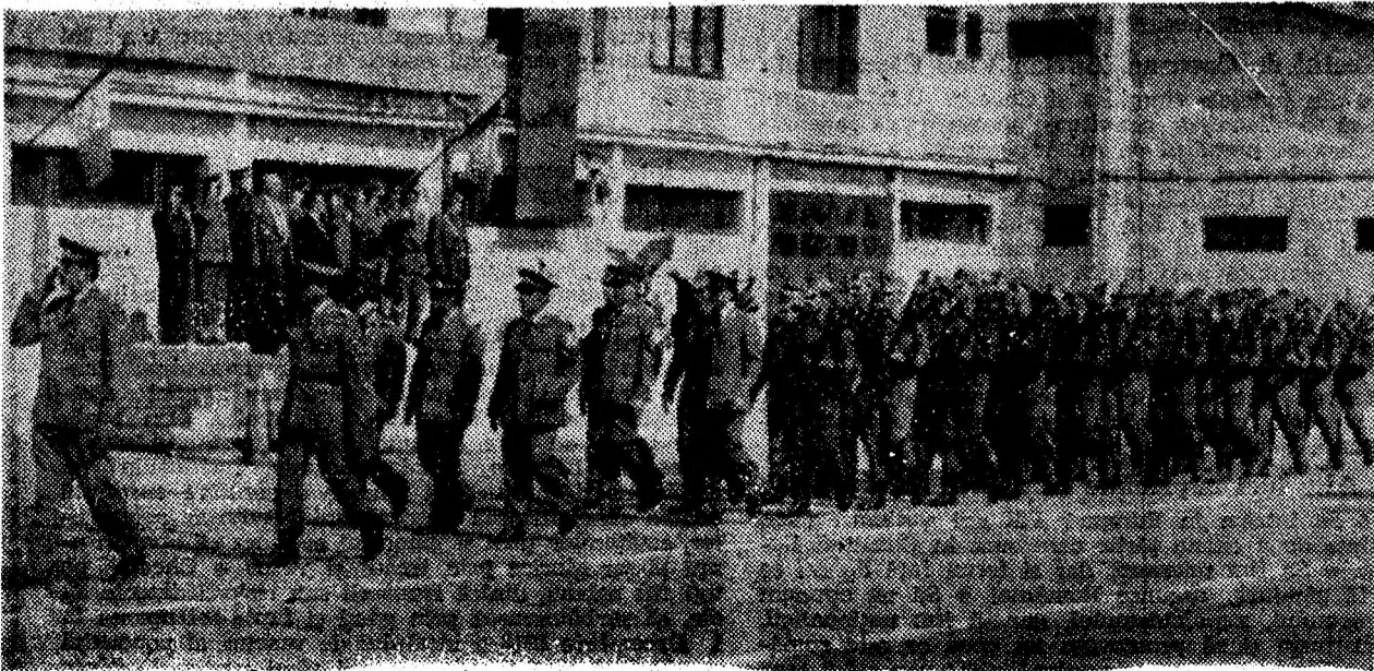
Aspect din timpul solemnității.