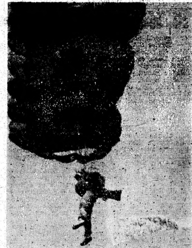
În curtea unității de pompieri din Deva sosește cu parașuta un cald mesaj de Ziua pompierilor.

Vanzătorul: — Pentru copilul dv. nu găsece nici o măsură potrivită! Vă rog să veniți cu alt copil!