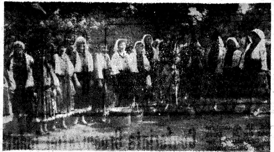
Ansamblul folcloric din Feregi, deținătorul trofeului „Frunza de stejar”, obținut la Zakopane (Polonia).

- Este adevărat că fiica dvs. trăia în concubinaj cu nimitul ? - Nu, onorat tribunal, trăia cu el în Ca- racial !