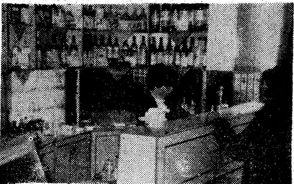
Restaurantul „Național” din Brad — servicii de calitate, accesibilitate — un local plăcut pentru timpul dumneavoastră liber!

Oameni ale căror rezultate reprezintă un exemplu meritoriu.