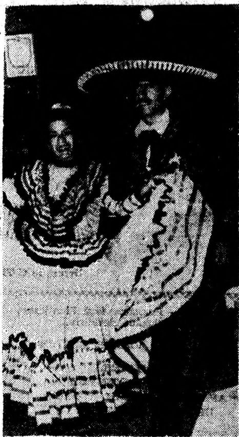
Până în insorita Americă latină vor duce mexicanii amintirea clipelelor plăcute petrecute la „Lido“ — elegantul „vas amiral“ al rețelei de restaurante ale S.C. „Transilvania“ S.A.

Eliberarea timpului gospodinei de grijele bucătăriei poate fi realizată pe multe căi dar cel puțin una este la îndemâna oricărui dintre noi: a apela la serviciile laboratoarelor de cofetărie și patiserie ale oricărei unități a S.C. „Transilvania“ S.A. Deva, cu comenzi de asemenea produse de înaltă calitate, în orice ocazie.