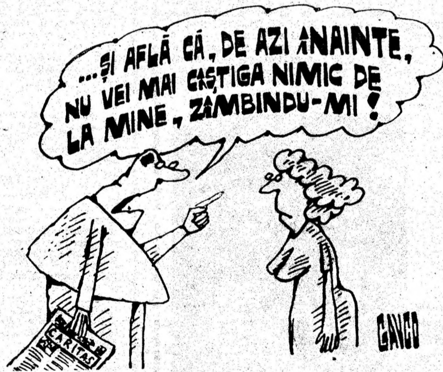
Desen de C-TIN GAVRILA

„Urugutanul a murit ! Facem comandă pentru al-