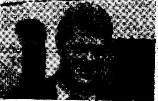
„Și Bill Clinton, cel care a ținut pumnii pentru Ursul Blond de la Kremlin. Foto: PAVEL LAZA (Imagini după televizor)