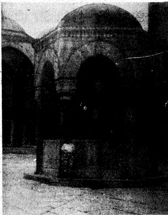
ISTANBUL. În sala de piatră a Moscheii Al-bastre, lângă fântâna cu apă sfântă.