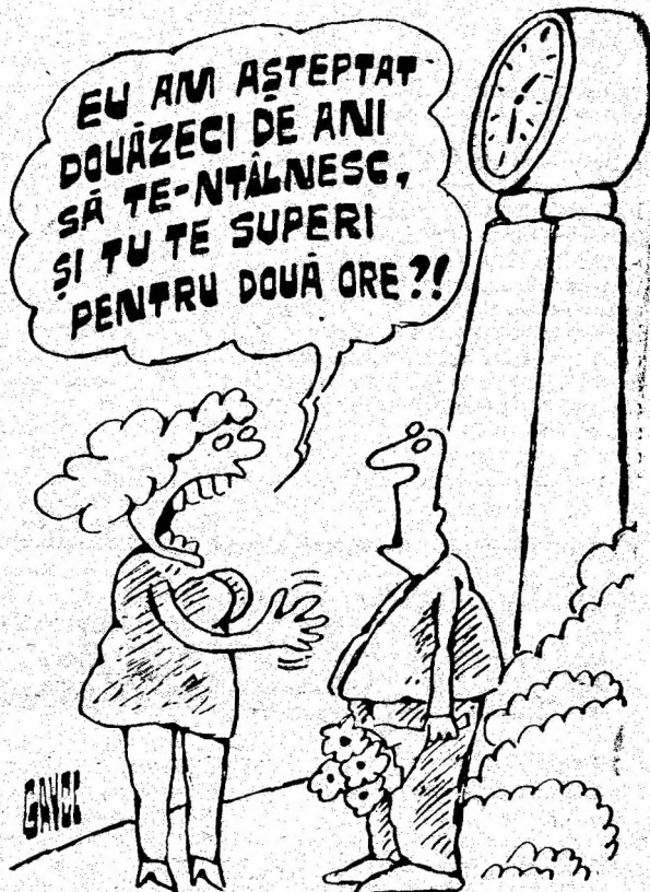
Desen de C-TIN GAVRIEA

Slujba religioasă a fost oficiată în napoletană, franceză și germană, în onoarea oaspeților străini. De remarcat că dintre cei 1500 de Cavaleri ai Ordinului Constantinian — recunoscut oficial din 1963 — fac parte importante personalități ale vieții publice italiene, altminteri republicani convingși, precum fostul președinte al Republicii, Francesco Cossiga, comandantul general al carabinieri, Luigi Federici și procurorul general al Neapolelui, Vincenzo Schiano di Colella. Unde se vede că după amărâta supă politică cea de toate zilele, puțin desert regească fascinează întotdeauna.