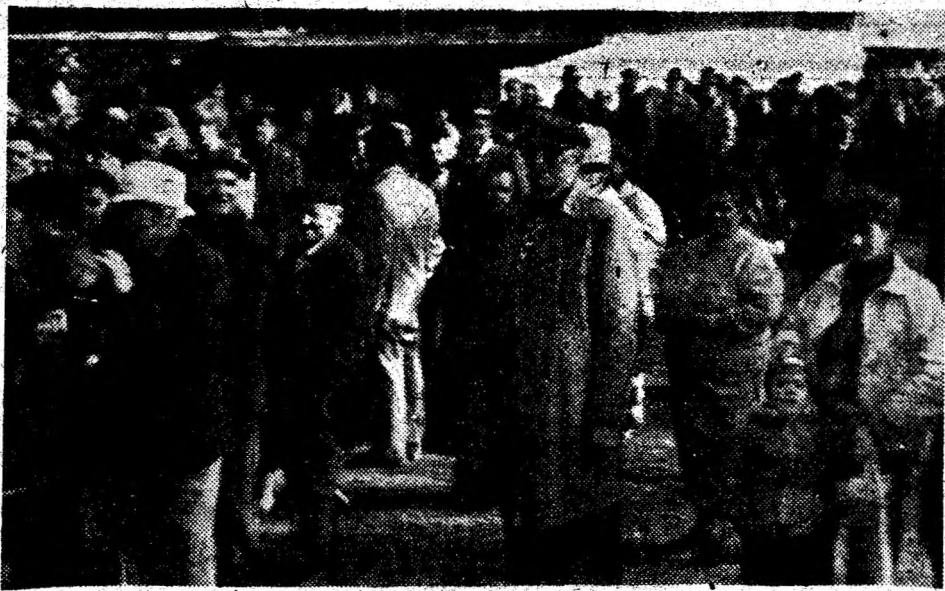
La Stadionul „Cetate” din Deva se restituie banii celor care i-au depus la firma „MIMMI” S.N.C. Galați, în cadrul jocului de intrajutorare.