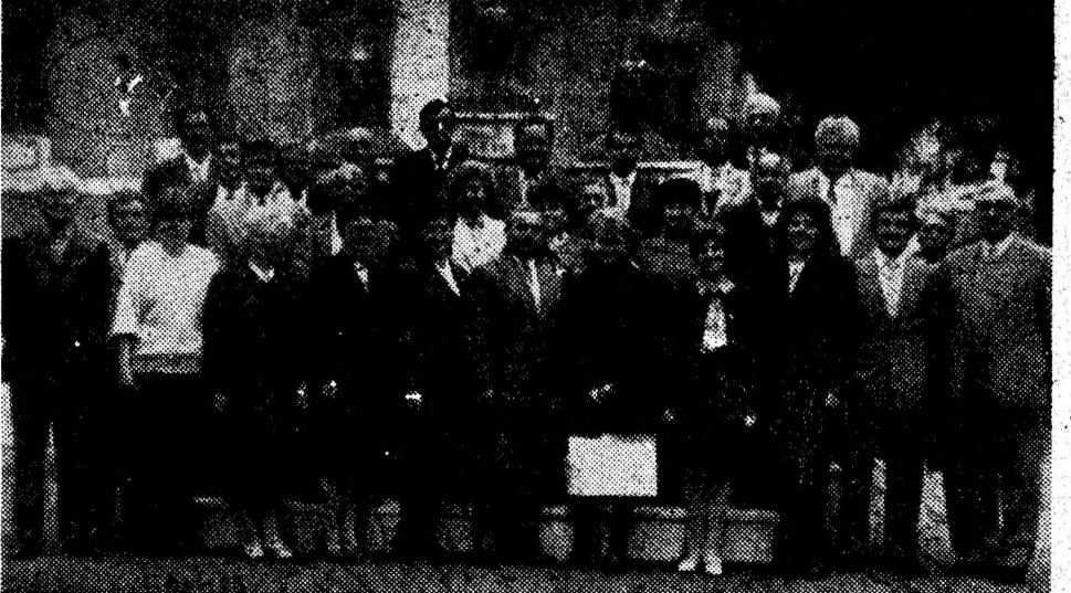
Casa de presă și editura „Cuvântul liber” Deva, în ziua de 22 septembrie 1993 — ziua constituirii în societate cu capital integral privat.