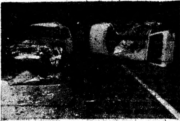
ACCIDENT ÎN NOAPTE. Cauze: obstacol nesemnificativ pe carosabil și neatenție în conducere. Consecințe: pierderi de vieți omenești și pagube materiale.

și poate înlocui fermoarul defect, economisind bani. „Aici sunt mai departe de centru, nu prea am vad comercial — ni se destăinuie proprietarul. Din păcate, nu se încurajează acest gen de comerț; pe străzile centrale se află bufet după bufet, dar întâlnești rar o croitorie, o eizmărie sau orice alt atelier de servicii cărora au nevoie atâția oameni” — ne declara dl. Poka. Așa este. Însă, sperăm că cerințele utilizării serviciilor de reparații ale unor bunuri materiale vor crește în ritm cu prețurile, că cei mai mulți, nu-și vor mai permite să-și cumpere prea multe lucruri noi, că trebuie să-și repare ghețele, hainele, că altfel nu mai merge. Deci, vor recăpăta strălucirile de altădată „brățările de aur”, cum erau denumite nu cu mult timp în urmă meseriile? SABIN CERBU